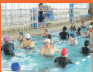
水中ウォーキング