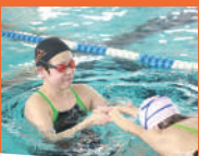
ワンポイントレッスン